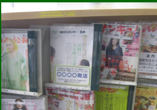
雑誌の棚に並んだ状態